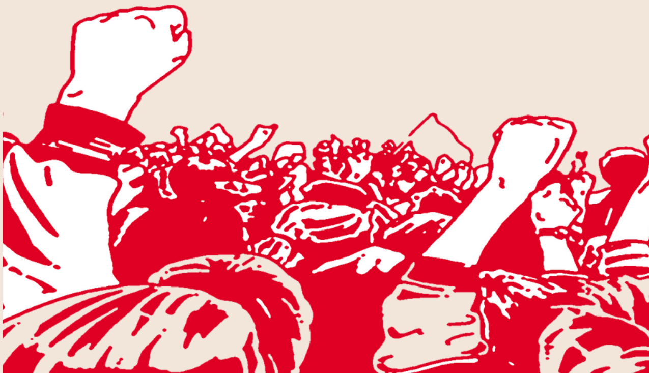
Gráfica popular china. Protesta obrera. s/d

Para que la clase trabajadora logre imponer sus intereses y conseguir sus objetivos debe de plantear una política proletaria independiente de los partidos políticos de la burguesía, independiente del Estado y de cualquier Gobierno e independiente de las organizaciones sindicales Charras. La movilización de los maestros del estado de México y la dura y sangrienta represión que algunos mentores sufrieron, por parte del gobierno del PRI del desfalleciente Del Mazo, no suscitaron ninguna reacción, simpatía ni muchos menos solidaridad del gobierno federal ni de Morena.