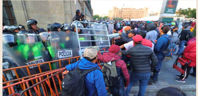
Sección XX. Manifestación frente a Palacio Nacional, CDMX. 16 de mayo de 2023.

López perdió algo más que una batalla sindical. Pierde también el apoyo del reducto sindical más combativo del país. Los profesores, a su vez, también ganan en conciencia: ahora saben que los que parecían ser sus amigos son traidores y que no hay que depositar en ellos y sus secuaces la menor confianza.